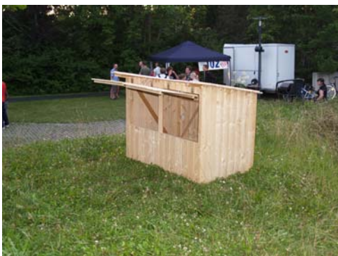
Die Kleine Bude